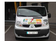
Minibus ça roule 276