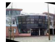
Collège Camille Claudel