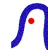
Lycée Val de Seine