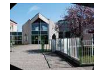
Collège Louis Pasteur