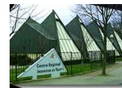
CRJS Petit Couronne