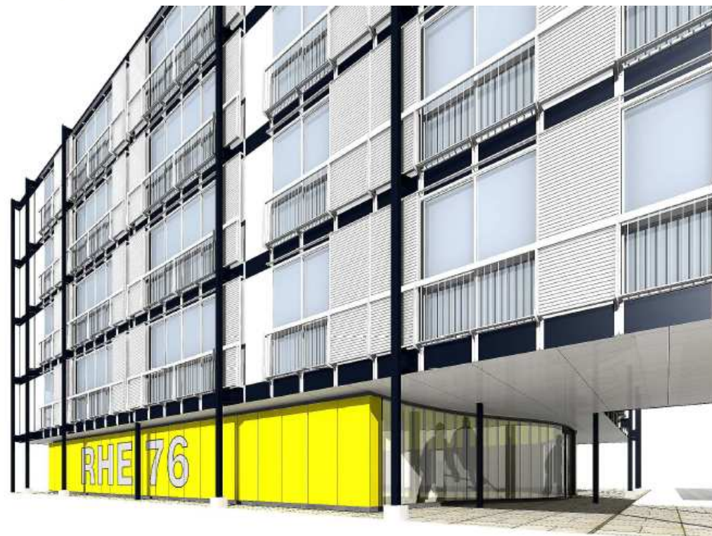
VUE DE LA FACADE DEPUIS LA RUE VERS L'ENTREE